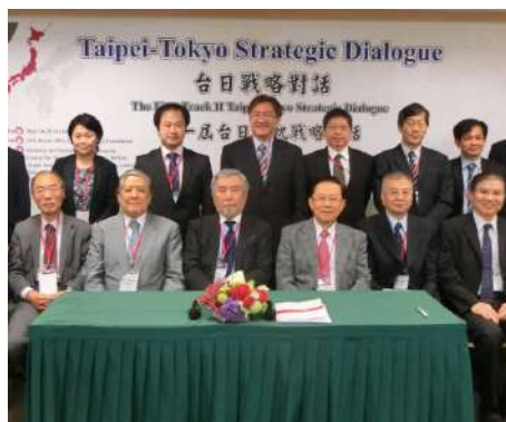
20140524 第一屆台日戰略對話

20140524、20150711、20160528、20170518、20180514、20190521、20201212 截至2020年12月止共舉辦 7 場