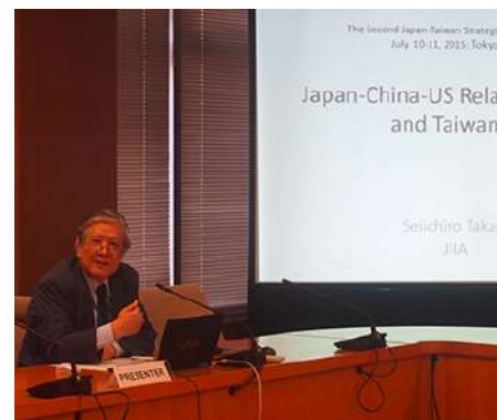
20150711 第二屆台日戰略對話