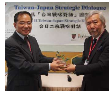
20160528 第三屆台日戰略對話